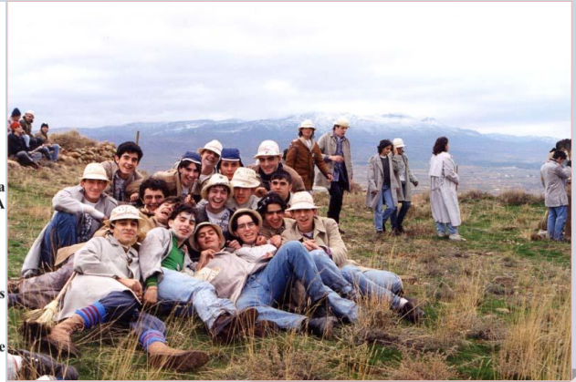
Quinta 98 en el castillo