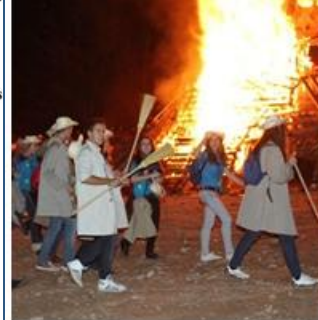
Quinta 2013 en la hoguera