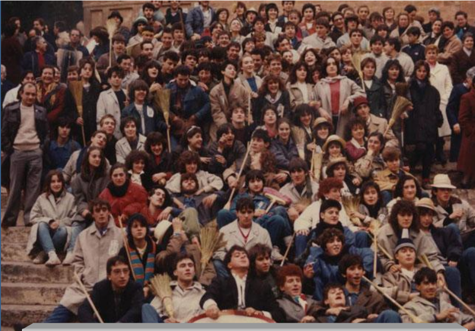
Quinta de 1987 este año celebran sus BODAS DE PLATA*

Aunque el servicio militar fue abolido en España el 31 de diciembre de 2001, en Arnedo y en otros muchos lugares los quintos se han convertido en una tradición festiva, por la que los jóvenes al cumplir la mayoría de edad hacen una especie de fiesta para recordar a los "antiguos" quintos" y sigue celebrándolo con igual entusiasmo, siguiendo un programa festivo muy semejante todos los años