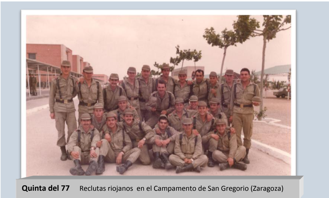
Quinta del 77 Reclutas riojanos en el Campamento de San Gregorio (Zaragoza)

El Gobierno mostro su agradecimiento a los millones de españoles que, a lo largo de la Historia, han prestado honrosamente su servicio militar para garantizar la seguridad y la independencia de España el Día de las Fuerzas Armadas, que se celebro el 2 de junio de 2002 en Alicante, en una ceremonia de homenaje y respeto a quienes han ofrecido su tiempo, su trabajo y, s casos, hasta su vida cumpliendo el servicio militar