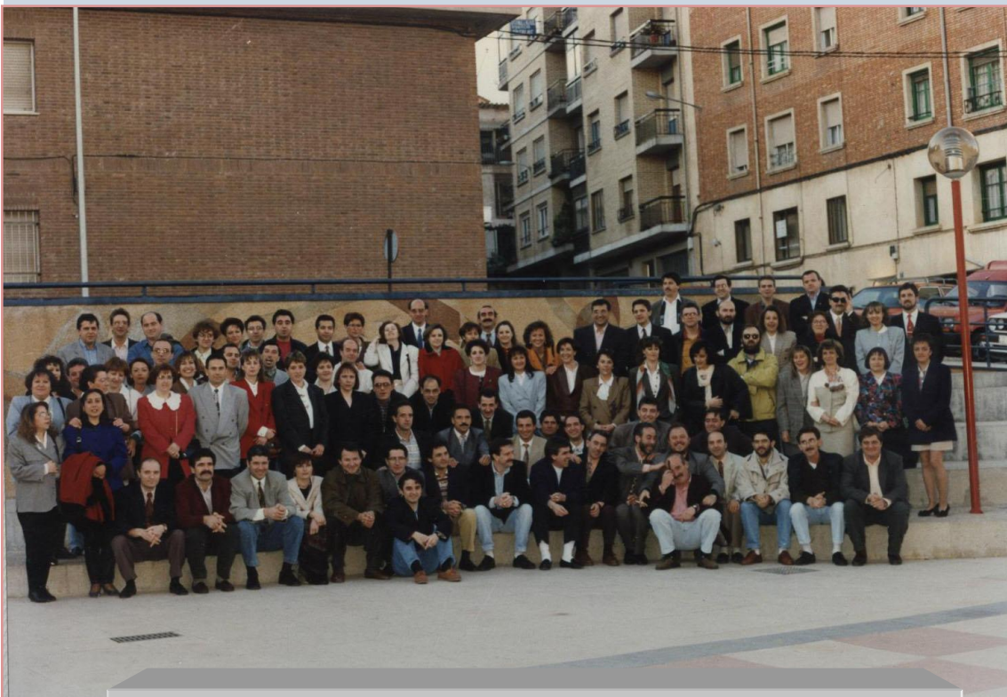
Quinta de 1977 *ENTREGA DE LA BLANCA*

Aunque el servicio militar fue abolido en España el 31 de diciembre de 2001, en Arnedo y en otros muchos lugares los quintos se han convertido en una tradición festiva, por la que los jóvenes al cumplir la mayoría de edad hacen una especie de fiesta para recordar a los "antiguos" quintos" y sigue celebrándolo con igual entusiasmo, siguiendo un programa festivo muy semejante todos los años