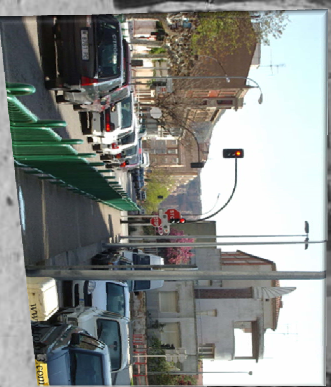
Fermín de Bla